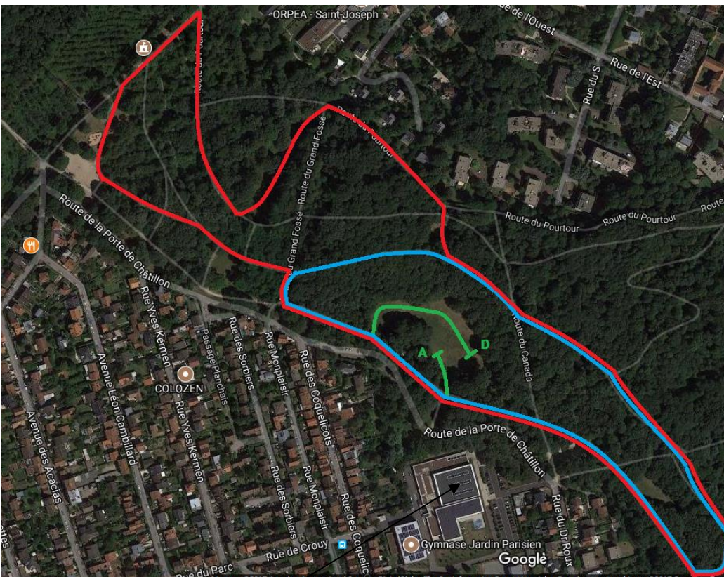
Piscine du Jardin Parisien